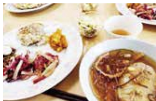
④おいしい料理に変身!

地域の集まりやイベントで、また、学校や飲食店、料理教室などで、いろいろなサルベージ・パーティが開催されています。あなたも開催してみませんか?