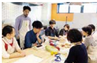
②持ち寄った食材から、できる料理をみんなで考える。