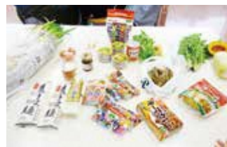
①参加者は家庭にある持て余した食材を持ち寄る。

意外な食材の組み合わせでおいしい料理ができた。家でも余りものをもっと活用したい。